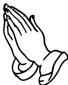
常常感恩 不住祷告